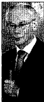
Herman Van Rompuy